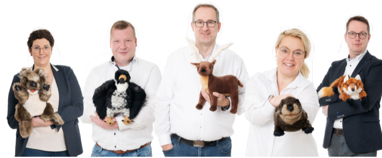
Das Team der TKRZ packt's an!

te mit versteckten Preisen. Wir stehen für eine klare und verständliche Kommunikation. Das zieht sich von