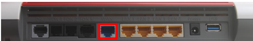
Hier wird das ankommende Kupfer-Netzwerkabel das von dem Genesis FiberTwist kommt eingesteckt