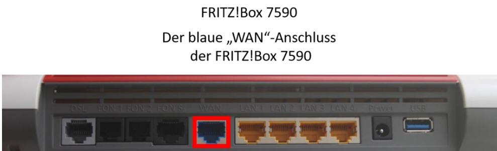
FRITZ!Box 7590 Der blaue „WAN“-Anschluss der FRITZ!Box 7590

Hier wird das ankommende Kupfer-Netzwerkabel das von dem Genesis FiberTwist kommt eingesteckt